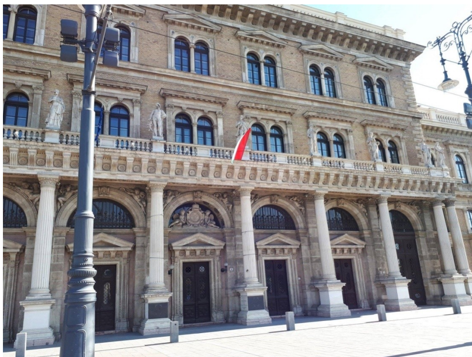
Fot. 5. Gmach główny Uniwersytetu Korwina w Budapeszcie

W latach 2000–2003 na skutek dalszego procesu integracji instytucji i organizacji naukowych do Uniwersytetu Ekonomicznego w Budapeszcie przyłączono Wyższą Szkołę Administracji Państwowej (2000 r.) oraz trzy wydziały Uniwersytetu Ogrodnictwa i Przemysłu Spożywczego (2003 r.).