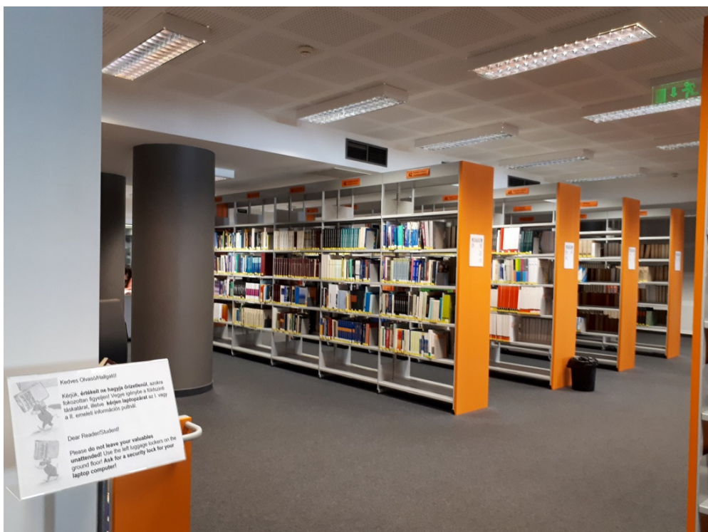
Fot. 4. Wolny dostęp do zbiorów w Bibliotece Uniwersytetu Korwina w Budapeszcie

profesorów i sporządzeniu ostatecznej listy książek do usunięcia z uniwersyteckiego księgozbioru listę przesyła się do Biblioteki Narodowej. To tu zapada decyzja w sprawie dalszych losów książek i czasopism. Biblioteka Narodowa sprawdza, której bibliotece (krajowej bądź zagranicznej) można je przekazać. W węgierskich bibliotekach żadna pozycja nie jest kasowana bez starannej analizy i próby znalezienia dla niej kolejnego lokum.