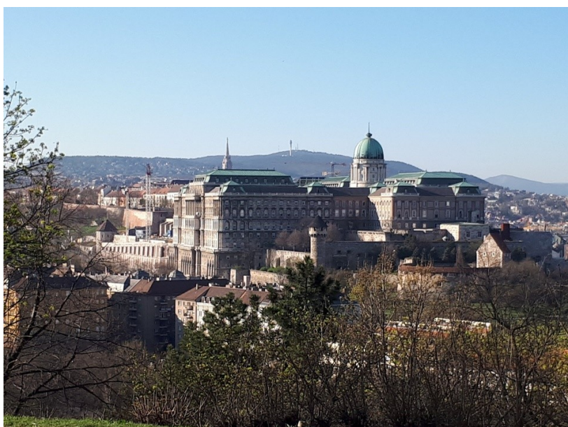
Fot. 1. Wzgórze Zamkowe w Budapeszcie widziane z Góry Gellerta – w Zamku Królewskim funkcjonuje Muzeum Narodowe i Biblioteka Narodowa Fot. M. Stąporek.

W roku akademickim 2016/2017 udało nam się pozyskać zgodę na tygodniowe szkolenie w Bibliotece Uniwersytetu Korwina w Budapeszcie (węg. Budapesti Corvinus Egyetem Egyetemi Könyvtár). Program szkoleniowy realizowany był za pośrednictwem programu Erasmus+. Akcja 1. Mobilność edukacyjna z krajami programu w roku akademickim 2016/2017. Oficjalną część programu, ustaloną i zaakceptowaną w dokumencie Staff mobility for training – mobility agreement przez obie dyrekcje bibliotek (wysyłającą i przyjmującą), realizowałyśmy w dniach 27–31 marca 2017 r. Przyznane środki finansowe umożliwiły przedłużenie pobytu. Pozwoliło to połączyć szkolenie zawodowe z poznawaniem historii, kultury i sztuki kraju naszych bratanków poprzez zwiedzanie najważniejszych zabytków stolicy Węgier, uzupełnione odpowiednią lekturą ( de facto wyjazd realizowany był w dniach 25 marca – 1 kwietnia 2017 r.).