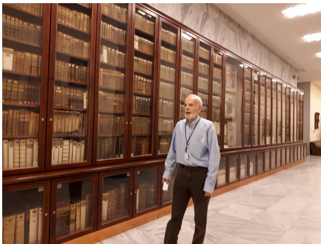
Fot. 2. Księgozbiór grafa Ferenc Széchényiego przekazany 25 listopada 1802 r. na rzecz pierwszej narodowej instytucji publicznej na Węgrzech – Państwowej Biblioteki Széchényiego (obecnie w zbiorach Biblioteki Narodowej)

Nieznajomość języka węgierskiego nie stanowiła większej bariery komunikacyjnej między nami a węgierskimi bibliotekarzami. Jak się bowiem szybko okazało, nie tylko nasza opiekunka, ale również pozostałe osoby komunikowały się z nami płynnie w języku angielskim.