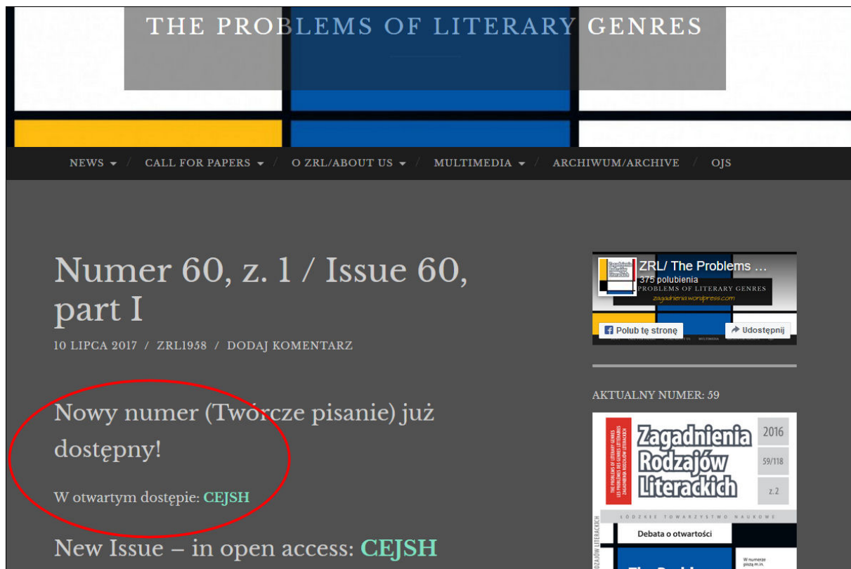
Rys. 3. Zrzut ekranu czasopisma „Zagadnienia Rodzajów Literackich” Źródło: Zagadnienia Rodzajów Literackich [online]. [Dostęp 15.07.2017]. Dostępny: http://zagadnienia.wordpress.com .

Poza tym na stronach baz danych informacja o możliwościach wykorzystania pełnego tekstu jest słabo widoczna lub w ogóle jej nie ma. Podobnie na stronach czasopism, redakcje rzadko chwalać się tym, że pełne roczniki można pobrać z bazy danych. Jednym z nielicznych wyjątków w tym względzie jest redakcja „Zagadnień Rodzajów Literackich”, która na głównej stronie czasopisma zachęca do przeczytania nowego numeru udostępnionego w bazie CEJSH.