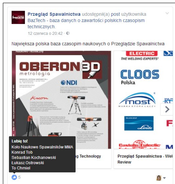
Rys. 2. Udostępnienie postu prezentującego czasopismo indeksowane w bazie danych BazTech Źródło: Przegląd Spawalnictwa [online]. Facebook, 12.06.2017 [Dostęp 16.06.2017]. Dostępny w: https://www.facebook.com/Przegl%C4%85d-Spawalnictwa-1691302164460353/ .

W celu uwidocznienia postu na temat czasopisma indeksowanego w bazie, obserwującym profil danego czasopisma, należy oznaczyć dany tytuł w poście na profilu BazTech. Za pomocą tak utworzonego odsyłacza administratorzy profilu „Przeglądu Spawalnictwa” nie tylko zauważyli, ale również udostępnili dany post na swoim profilu (Rys. 2). Dodatkowy opis – Największa polska baza czasopism naukowych o „Przeglądzie Spawalnictwa” – dowodzi nawiązaniu pozytywnej relacji. Pomijając przyjemne twórcom bazy epitety, warto zwrócić uwagę, że oprócz kontaktu zyskano większy zasięg i rozpoznawalność profilu bazy danych BazTech, jak i samej bazy, w branży spawalniczej. Udostępniony przez pismo post polubiło m.in. Koło Naukowe Spawalników.