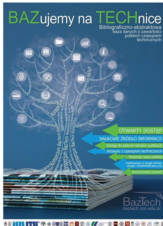
Rys. 4. Plakat promujący bazę danych BazTech. Aut. Natalia Cofta.

Zwycięski projekt może być wykorzystany przez organizatora konkursu, do stworzenia innych materiałów reklamowych związanych z bazą: nalepek, informacji na stronie WWW bazy BazTech itp. Plakaty w wersji drukowanej zostały przekazane w liczbie ok. 10 szt. każdej z instytucji Konsorcjum.