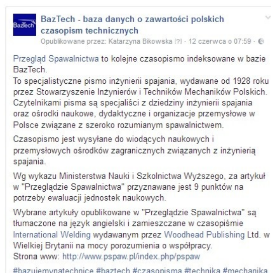
Rys. 1. Post prezentujący czasopismo indeksowane w bazie danych BazTech Źródło: BazTech – baza danych o zawartości polskich czasopism technicznych [online] Facebook, 12.06.2017. [Dostęp 16.06.2017]. Dostępny w: https://www.facebook.com/bazabaztech/posts/712400985610733 .

Kolejny cel promocyjny administratorów profilu BazTech na Facebooku to nawiązywanie relacji z wydawcami indeksowanych w bazie czasopism. W tym celu prezentowane są wybrane tytuły periodyków z zakresu nauk technicznych. Przykład wpisu eksponującego czasopismo „Przegląd Spawalnictwa” (Rys. 1) ilustruje zasadność tego typu działań.