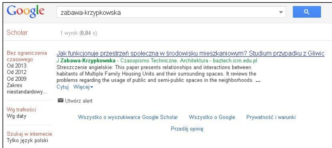
Rys. 5. Wyszukiwanie w Google Scholar według nazwiska autora publikacji rejestrowanej w bazie BazTech Źródło: Google Scholar [on-line]. [Dostęp 06.05.2013]. Dostępny w World Wide Web: http://scholar.google.pl/ .