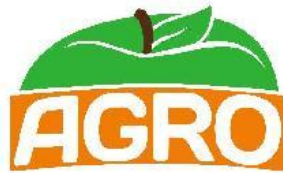
Rys. 5. Logotyp bazy AGRO Źródło: Baza AGRO [on-line]. [Dostęp 08.04.2013]. Dostępny w World Wide Web: http://agro.icm.edu.pl .